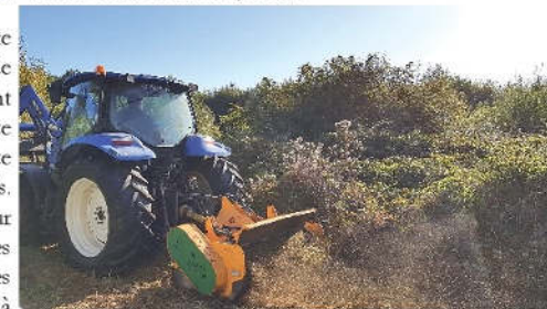
Opération de broyage

- La Charte Natura 2000 : il s'agit d'un outil d'adhésion volontaire identifiant les « bonnes pratiques » pour le maintien d'un état de conservation favorable des habitats naturels et des espèces ayant justifié la désignation du site. Elle comprend une liste d'engagements et de recommandations généraux, ainsi qu'une liste de recommandations spécifiques selon les milieux concernés. L'engagement à la Charte se fait à la parcelle cadastrale et pour une durée de 5 ans. La signature de cette charte ouvre droit à des avantages comme l'exonération des taxes foncières sur les propriétés non bâties, une exonération des droits de mutation à titre gratuit pour certaines successions et donations, etc.