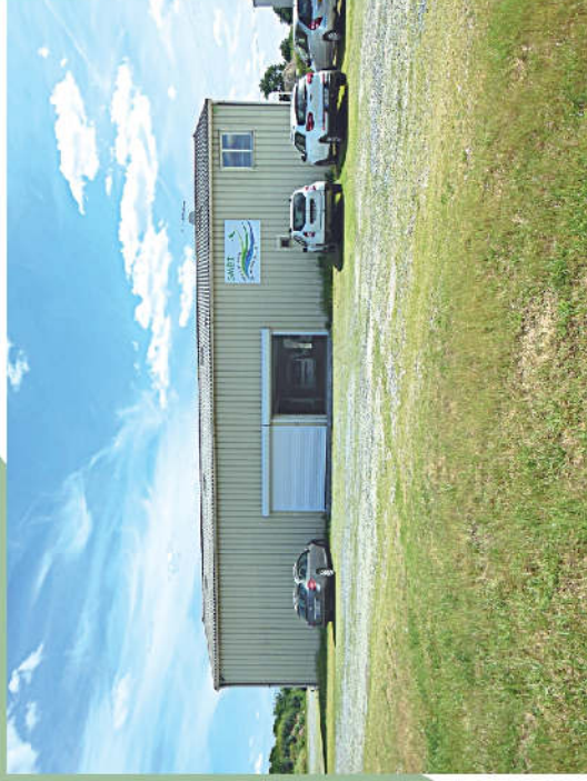
Locaux du SMBI