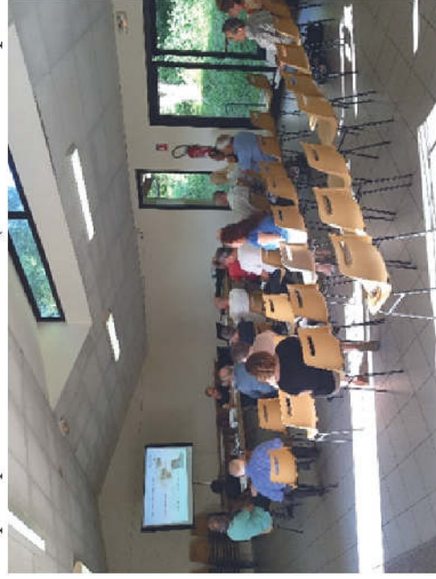
Présentation du PPG de la Crempse aux riverains à Saint-Hilaire-d'Estissac

Par bassin, un programme d'action est mis en œuvre à la suite d'un diagnostic du fonctionnement des milieux aquatiques et bassin versant (état du milieu et pressions).