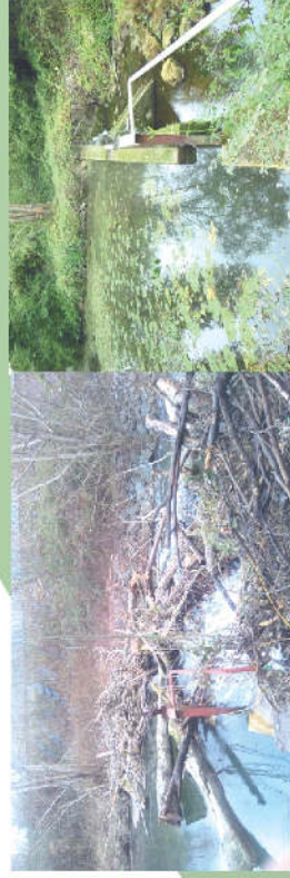
Avant et après travaux sur le seuil des 5 ponts (le Vern à Neuvic)

En complément de ces P.P.G. locaux, un plan d'action Global sur l'ensemble du bassin versant de l'Isle aval (intégrant l'ensemble des affluents) est en cours de réalisation. Il permettra à terme une gestion cohérente et hydrographique par l'intermédiaire des actions du S.M.B.I.