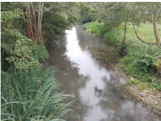
La Vern (aval), Champroueix