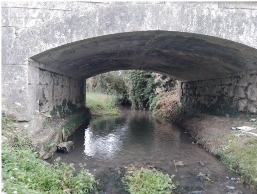
La Beauronne des Lèches