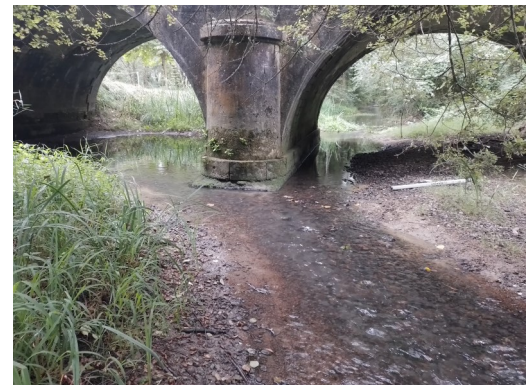
Le Vern (médián), RD4