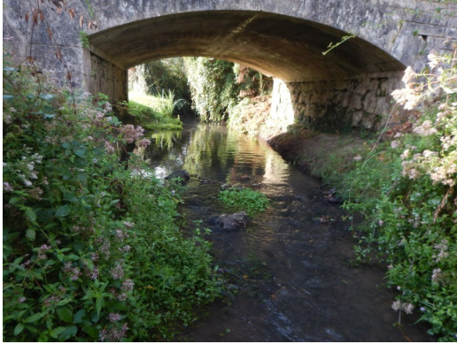
La Beauronne des Lèches