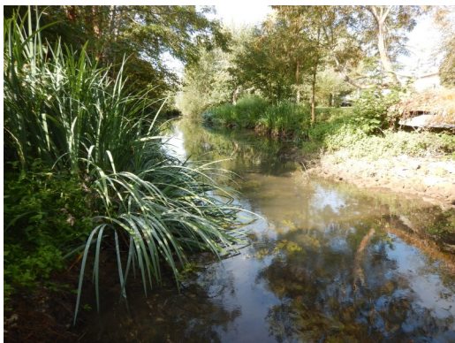
La Vern (aval), Champroueix