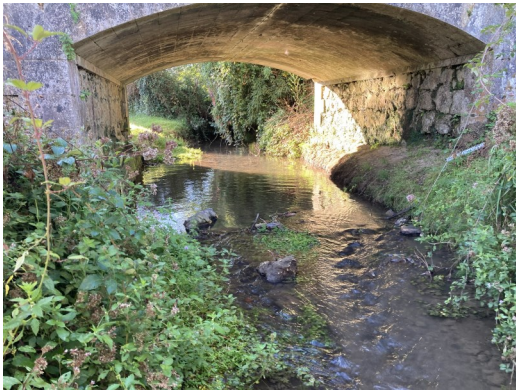
La Beauronne des Lèches