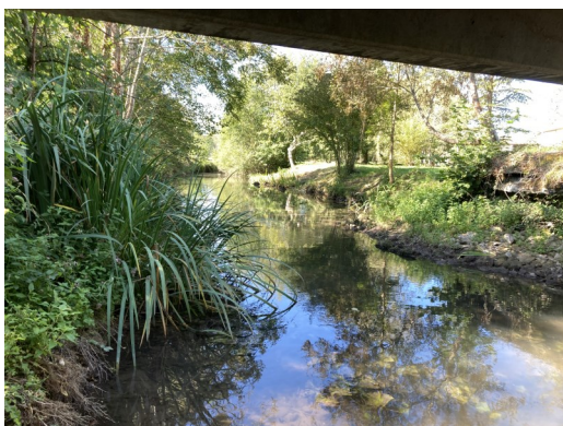
La Vern (aval), Champroueix